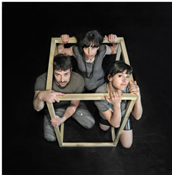
Mention Obligatoire : Photo © Rolline Laporte