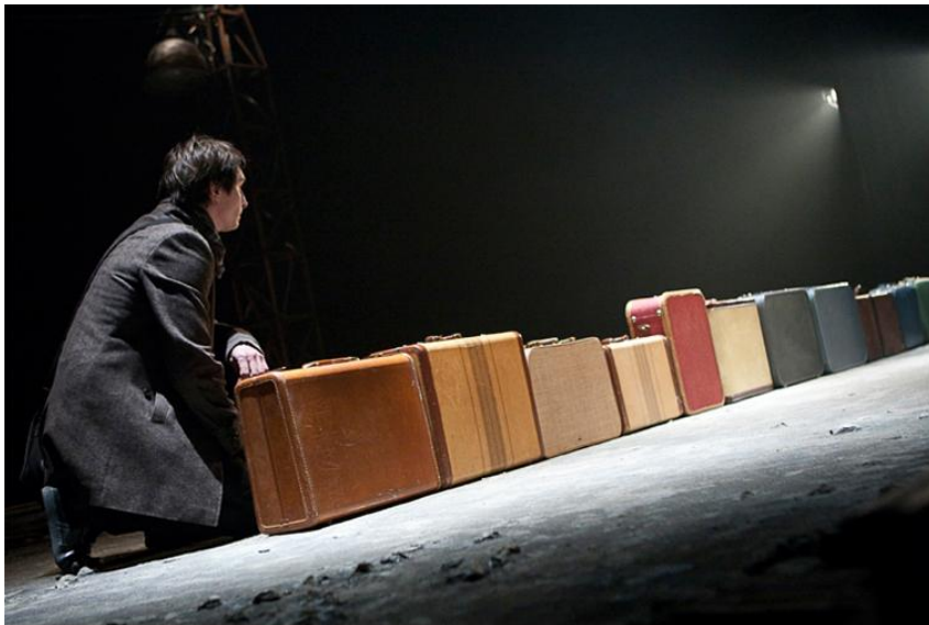
LA ROBE DE GULNARA