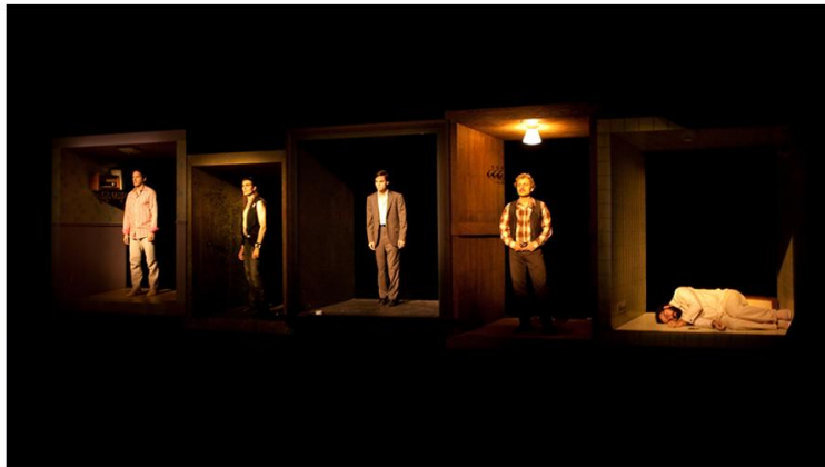
THE DRAGONFLY OF CHICOUTIMI