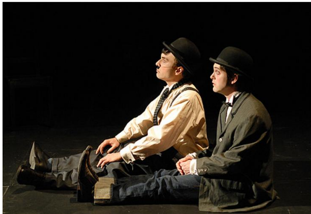
ABRAHAM LINCOLN VA AU THÉÂTRE